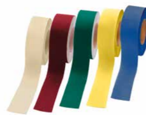
Nouveaux accessoires : Stamcoll Tape

Les couleurs d'impression peuvent différer des couleurs réelles de la gamme de Stamisol FA POP et n'ont qu'un caractère informatif (échantillons des couleurs sur demande)